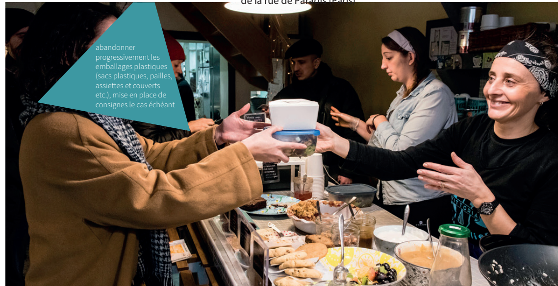
Une semaine sans déchets au sein des commerces de la rue de Paradis (Paris)

abandonner progressivement les emballages plastiques (sacs plastiques, pailles, assiettes et couverts etc.), mise en place de consignes le cas échéant